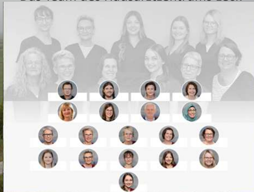
Das Team des Hausarztzentrums Leck